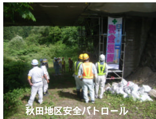
秋田地区安全パトロール

当現場の主体工事は、国道13号線における橋梁の耐震補強工事です。橋梁の本橋が4橋、側道橋が2橋で施工区間が約2.4kmあります。