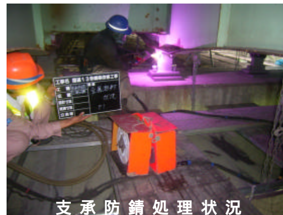
支 承 防 錆 処 理 状 況

7月2日には秋田地区安全パトロールも実施され、対象現場となりましたが、重大な是正もありませんでした。今後も今一度身を引き締め、無事故無災害にてがんばります。