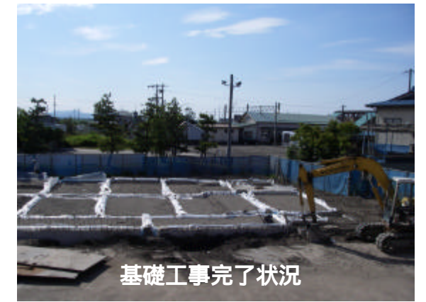
基礎工事完了状況