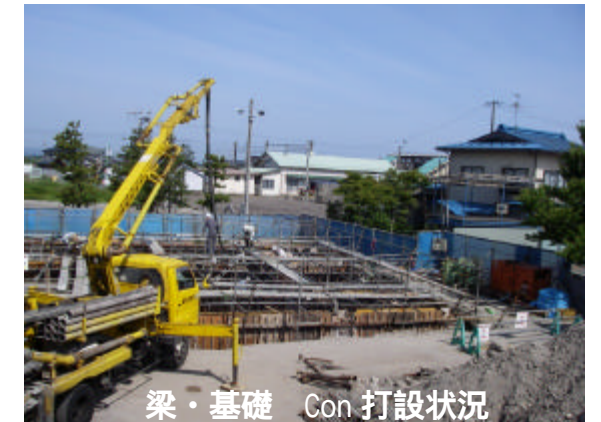
梁・基礎 Con 打設状況