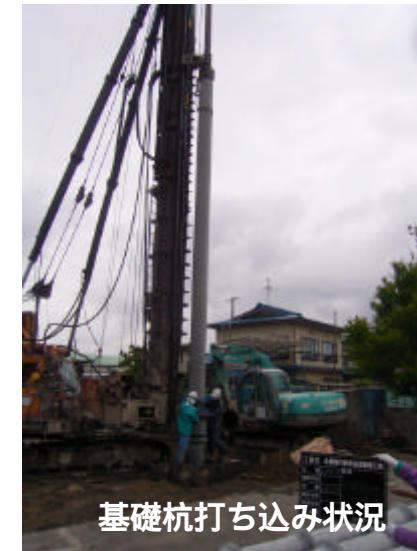
基礎杭打ち込み状況

当作業所は、株式会社シブヤ建設工業との共同企業体です。 現在は、基礎工事(田仲建設)も終わり来月からは鉄骨組立工事を予定しています。 これからも無事故無災害に努め工期内完成に向けがんばって行きたいと思っております。